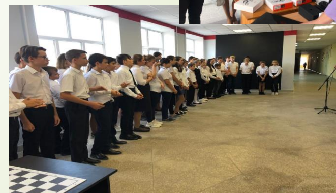
Торжественное открытие центра дополнительного образования цифрового и гуманитарного профилей «Точка роста» «МБОУСОШ№9 станицы Тамань Темрюкского района»